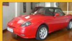
Fiat Barchetta 1.8 1997