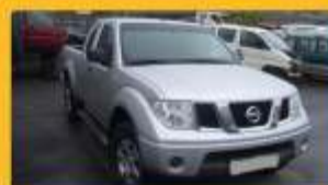
Nissan Navara 2.5 td 2006