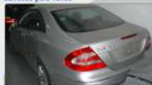
Mercedes CLK 270 CDI 2004