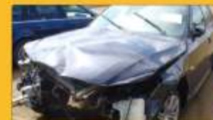
Bmw 530 d 2005