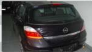
Opel Astra H 1.7 Cdti 2004