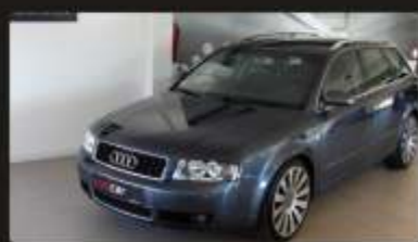
Audi A4 Avant 1.9 Tdi MG Ano: 2004 - 26.000€