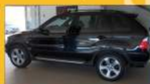
BMW X5 3.0d 2004