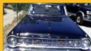
Dodge 330 Sedan 1964