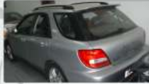
Subaru Impreza Wagon WRC 2001