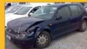
VW Golf III 1.6 1999