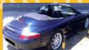
Porsche 911 Carrera 4 1999