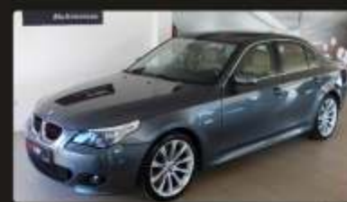
BMW 530 d Pack M Ano: 2005 - 51.500€

Rua Eng. Vila Lobos, Nº6 4700 Fraião - Braga (Junto ao Carrefour) Tel. 309 934 347 - geral@craftcar.pt