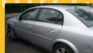
Opel Vectra C 2.2 dti 2002

Utilidades para peças e salvados em destaque