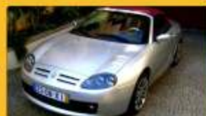
MG TF 115 2004