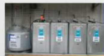
Depósitos para os fluidos