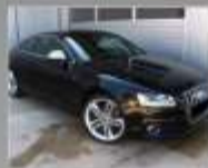
AUDI A5 S5 4.2 v8 - 2007