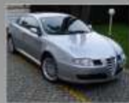
ALFA ROMEO GT 1.9 JTD M-Jet - 2004