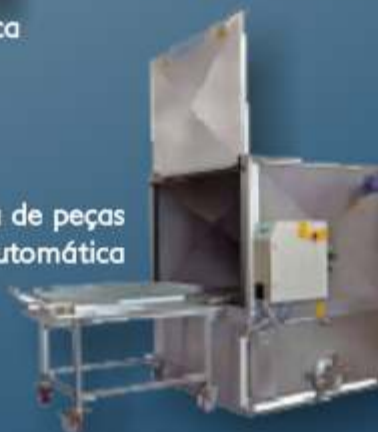
Limpeza de peças automática