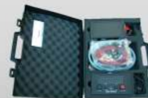
Neutralizador de air-bags

Rua João Abel Manta, N.º17 - 4.º Dto. 2670-528 Loures Portugal