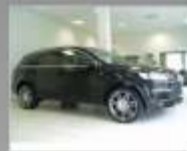
AUDI Q7 3.0 TDI V6 - 2007