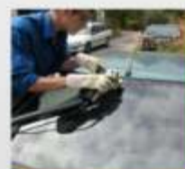
Equipamento para retirar pára brisas