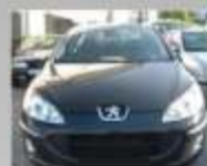
PEUGEOT 407 2.0 HDI - 2004