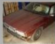
JAGUAR DAIMLER 4.0 228cv Aut. - 1988