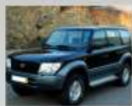
TOYOTA L.CRUISER 3.0 TD - 1998