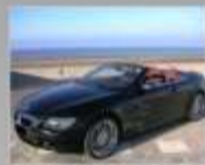
BMW Serie-6 Cabrio 630ci - 2007