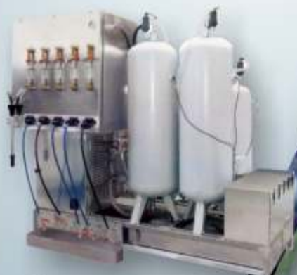
Sistema automático por alto vácuo

Sistemas modulares inovativos aonde a Segurança, a Produtividade, a Autonomia e Fiabilidade, o Baixo Custo de funcionamento e manutenção aliados á sua imagem colocam-nos no Top em equipamentos para a descontaminação de VFV's. Cumprem todas as normas estabelecidas com a Directiva 2000/53 CE.