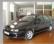
FIAT MAREA WEEKEND 1.6 - 1997