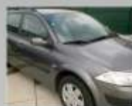
RENAULT MÉGANE BREAK 1.9 DCI - 2004