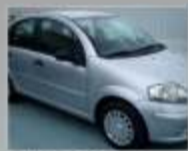
CITROEN C3 1.1 61cv - 2004