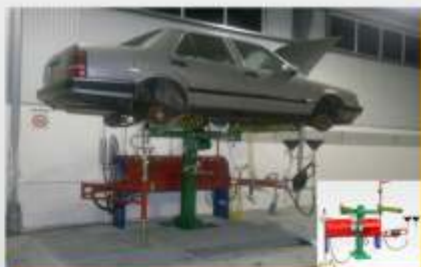
Estação SEDA EASY DRAIN c/ coluna fixa capacidade para 20 viaturas/dia (MEALHADA - AUTO IC2)