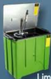
Limpeza de peças biológica