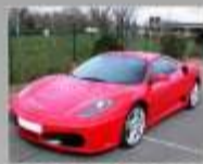
FERRARI F430 2006