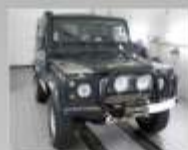
LAND ROVER DEFENDER TD5-1996