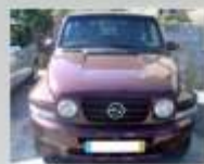
SSANGYONG KORANDO TDI -1998