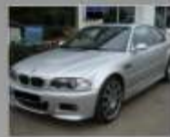
BMW Serie-3 Coupé M3 3.2 - 2001