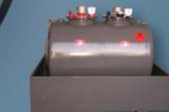
Reservatório de combustível