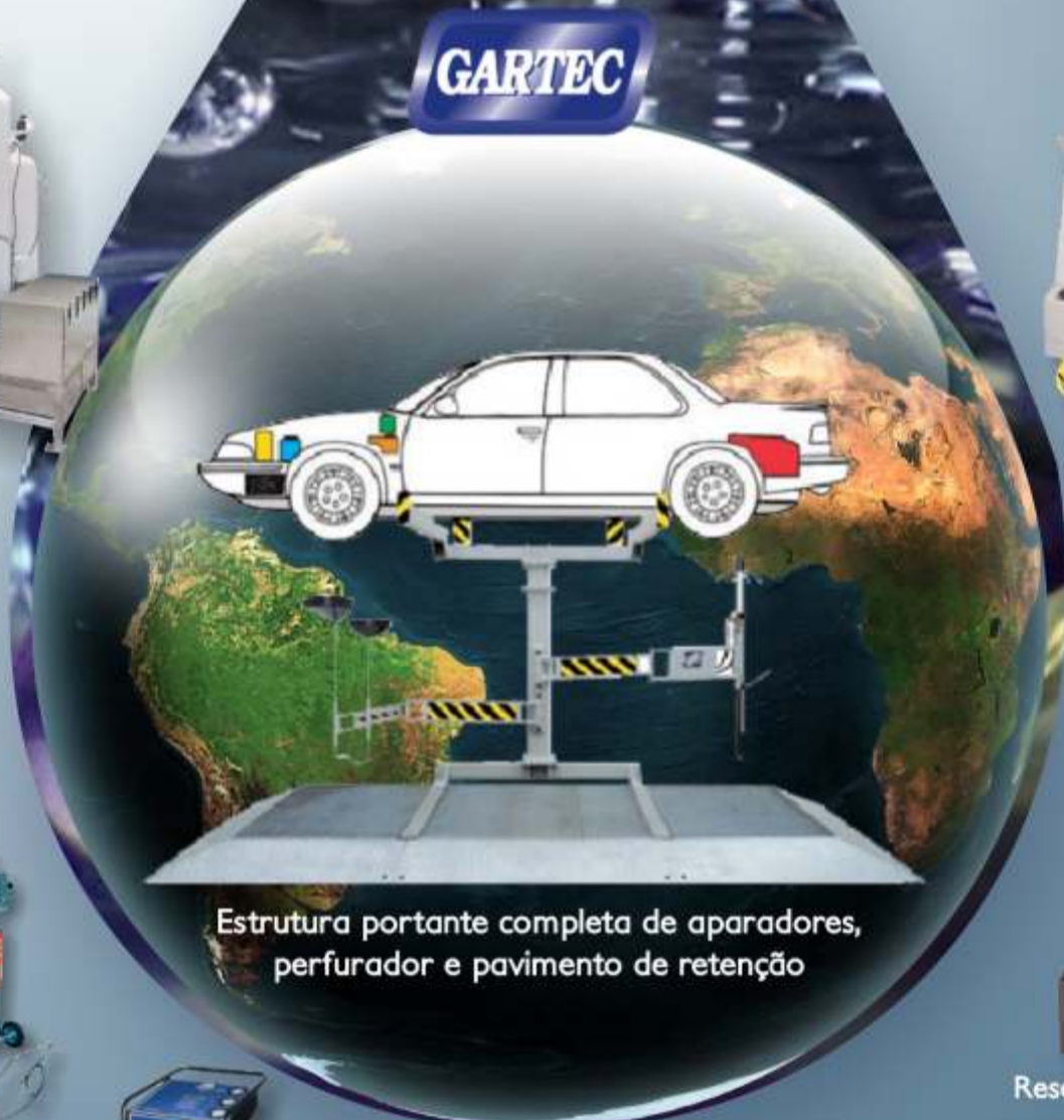
Estrutura portante completa de aparadores, perfurador e pavimento de retenção