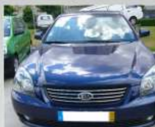
KIA MAGENTIS 2.0 CRDi 140cv - 2006