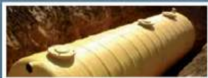
Separador de hidrocarbonetos