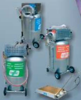
Sistema móvel pneumático