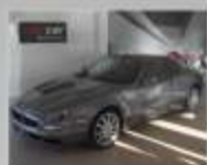
MASERATI 3200 GT 2001