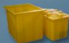
Caixa de baterias