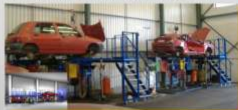
Estação SEDA DOUBLE STATION capacidade para 100 viaturas/dia (CARREGADO - BATISTAS, SA)