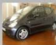
MERCEDES-BENZ A 170CDi - 1999