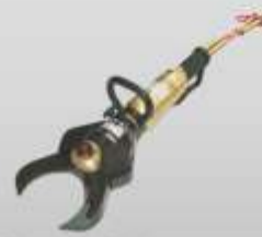
Tesoura hidráulica para cortar catalisadores