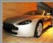
ASTON MARTIN 4.3 8v - 2007