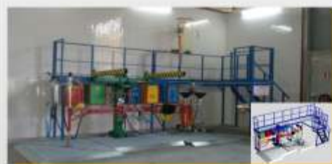
Estação SEDA SINGLE STATION capacidade para 50 viaturas/dia (TROFA - NORSIDER)

Equipamentos para descontaminação, desmantelamento e reciclagem de Veículos em Fim de Vida. Soluções para viaturas ligeiras, pesadas e máquinas industriais.