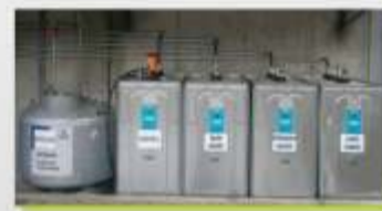
Depósitos para os fluidos