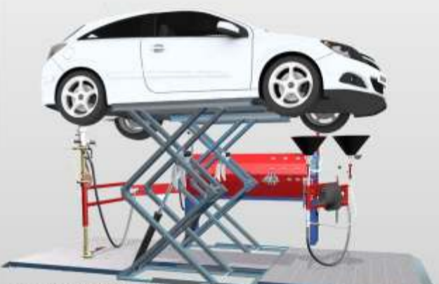
Estação SEDA EASY DRAIN Estação de descontaminação de V.F.V. Capacidade para 20 viaturas/dia

Equipamentos para descontaminação, desmantelamento e reciclagem de Veículos em Fim de Vida. Soluções para viaturas ligeiras, pesadas e máquinas industriais.