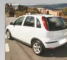
CORSA C CDTI 2005