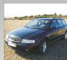
A4 AVANT TDI 1999