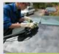
Equipamento para retirar pára brisas