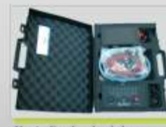
Neutralizador de air-bags

Quinta do Carmo, nº 10 2685-129 Sacavém Portugal