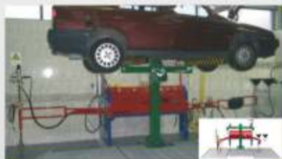
Estação SEDA EASY DRAIN Compact cap. 20 viaturas/dia (S.M.FEIRA - PAULO DE OLIVEIRA, Lda)