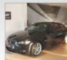
BMW 335 CDA 2007