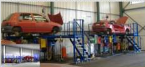
Estação SEDA DOUBLE STATION capacidade para 100 viaturas/dia (CARREGADO - BATISTAS, SA)