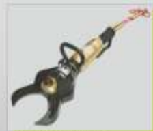
Tesoura hidráulica para cortar catalisadores