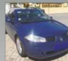
MÉGANE II CAB. 2004