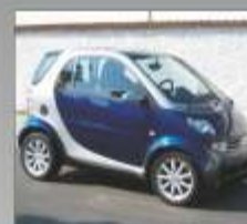
FORTWO COUPÉ 2005