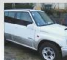
VITARA M.T. TD 1996