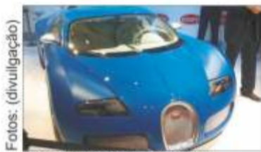
Bugatti Veyron Centenaire