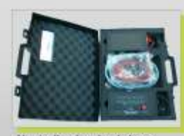
Neutralizador de air-bags

Quinta do Carmo, n° 10 2685-129 Sacavém Portugal