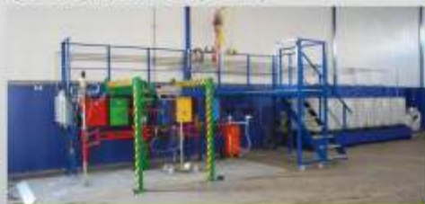
Estação SEDA SINGLE c/ plataforma (A SOCORSUL, LDA. - Sto. António Tojal, Loures)