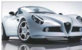
Alfa Romeo 8C Spider