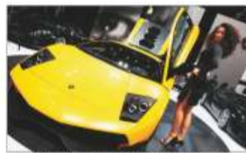
Lamborghini Murciélago LP670-4