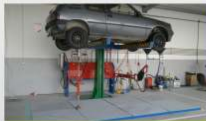
Estação SEDA EASY DRAIN Compacto c/ elevador (LUMAPEÇAS, LDA. - Carriço, Leiria)