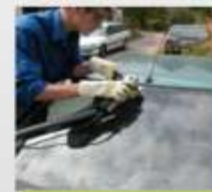
Equipamento para retirar pára brisas