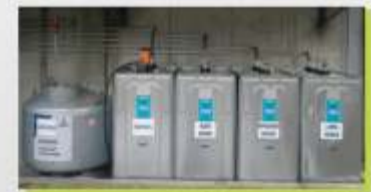
Depósitos para os fluidos