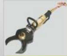
Tesoura hidráulica para cortar catalisadores