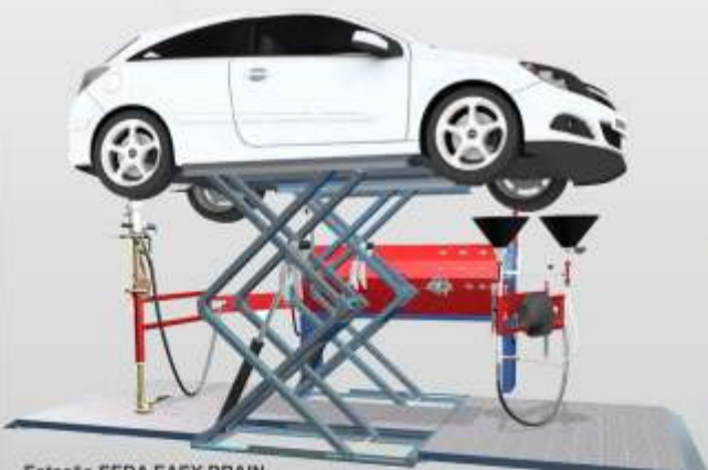
Estação SEDA EASY DRAIN Estação de descontaminação de V.F.V. Capacidade para 20 viaturas/dia

Equipamentos para descontaminação, desmantelamento e reciclagem de Veículos em Fim de Vida. Soluções para viaturas ligeiras, pesadas e máquinas industriais.